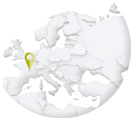
FRANCE – Le Groupe La Poste