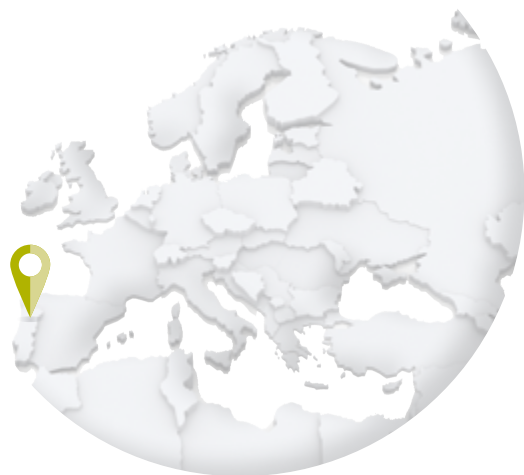
PORTUGAL – CTT