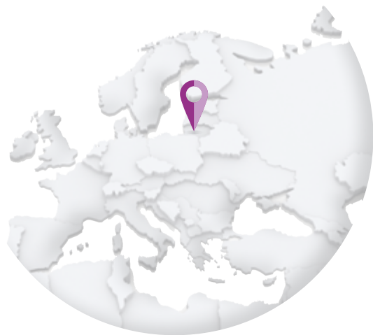
LITUANIE – Lietuvos paštas