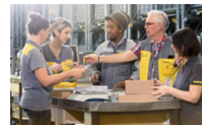
Swiss Post, Coup de Cœur Environnement 2015

« Le développement des services de proximité est un besoin de plus en plus présent avec le vieillissement de la population. Posti exploite les synergies de son réseau de distribution national pour offrir des solutions flexibles aux municipalités tout en aidant les personnes âgées dans leurs tâches quotidiennes. »