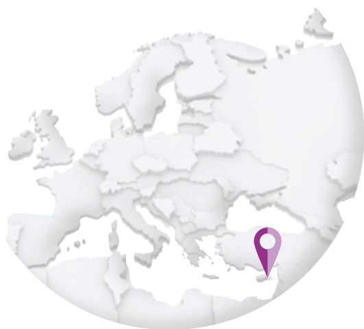
CHYPRE – Cyprus Post