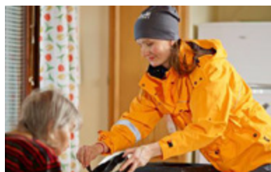
Posti, Coup de Cœur Société 2015

« Les risques psychosociaux sont un sujet de préoccupation majeure dans toute organisation compte tenu de la situation économique. Les managers de nos entreprises ont un rôle essentiel dans la détection, la reconnaissance et la gestion de ces risques. Il est donc primordial de les former. »