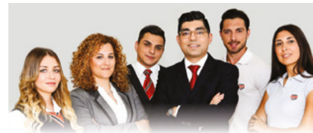
MCAST Diploma in Postal Services

Cette offre de formation délivre aux étudiants les connaissances nécessaires pour réaliser une brillante carrière au sein de MaltaPost. En plus de contribuer à la formation des jeunes talents de demain, l'initiative a aussi pour effet d'améliorer la qualité de service, ainsi que la réputation de l'entreprise en tant qu'employeur de premier choix.