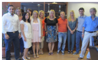
Hellenic Post - ELTA, Coup de Cœur Capital humain 2015

Rendez-vous en 2017 pour la prochaine édition des Coups de Cœur RSE de PostEurop !