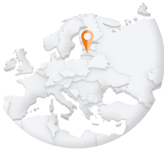
LITUANIE – Lietuvos paštas