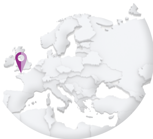
JERSEY – Jersey Post