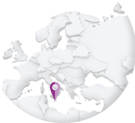
MALTE – MaltaPost