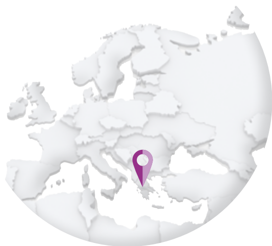
GRÈCE – Hellenic Post - ELTA