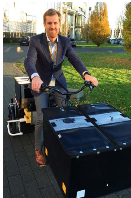
Une visite guidée exclusive du DHL Innovation center était au programme et les participants ont eu l'occasion de tester

La réunion de lancement était axée sur les véhicules électriques des flottes postales. Des orateurs de La Poste France, CTT Portugal, Post Norge et Deutsche Post ont successivement présenté les projets de leurs opérateurs respectifs en la matière. Il est clairement apparu qu'un large éventail de solutions pour les véhicules électriques non polluants est déjà déployé ou testé. En fonction des spécificités des pays, différentes expériences en termes de véhicules électriques ont été présentées et partagées avec l'assemblée. Une start-up allemande a également présenté un scooter électrique innovant et proposé des solutions pour la distribution postale.